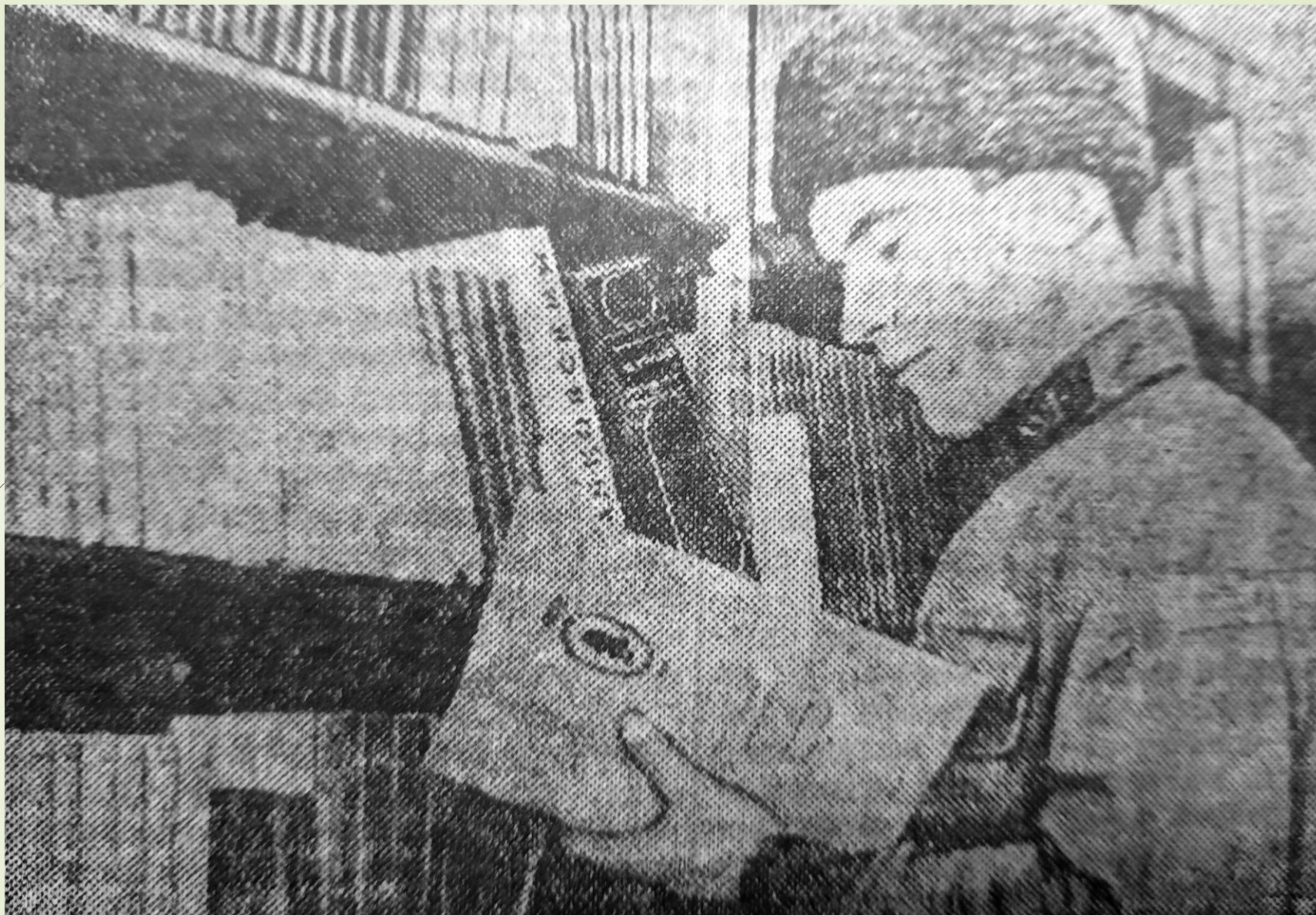
В клубной библиотеке воинской части горских национальностей Северного Кавказа. © Дагестанская правда. 1938. 23 февраля.