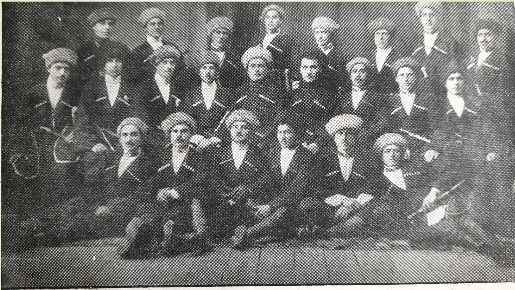
Командиры и политработники Отдельного Дагестанского Национального кавалерийского дивизиона